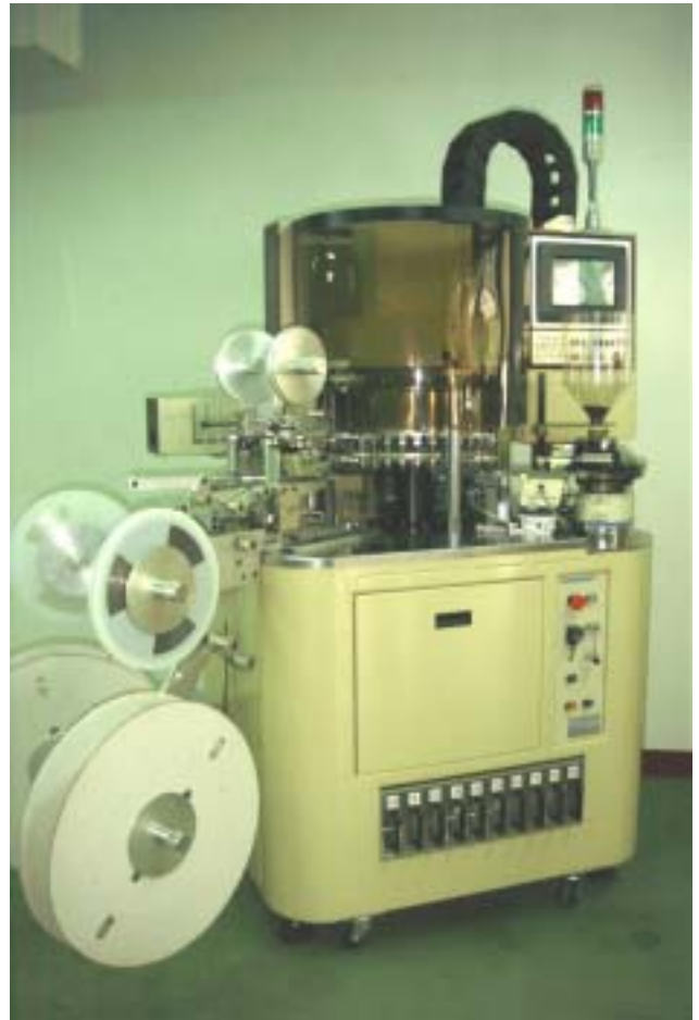
(本圖片僅供參考 This photo for reference)

TS-300 是全自動將表面封裝型電子零件由散裝而至成帶包裝的設備，藉由真空吸嘴盤的運轉而將產品穩定而快速的送至各工作站作測試、印字、分類、包裝之工作。